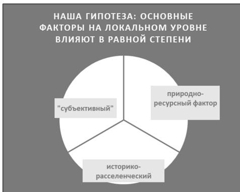
Рис. 2 Факторы, влияющие на развитие деревни Кузрека. Составлено авторами